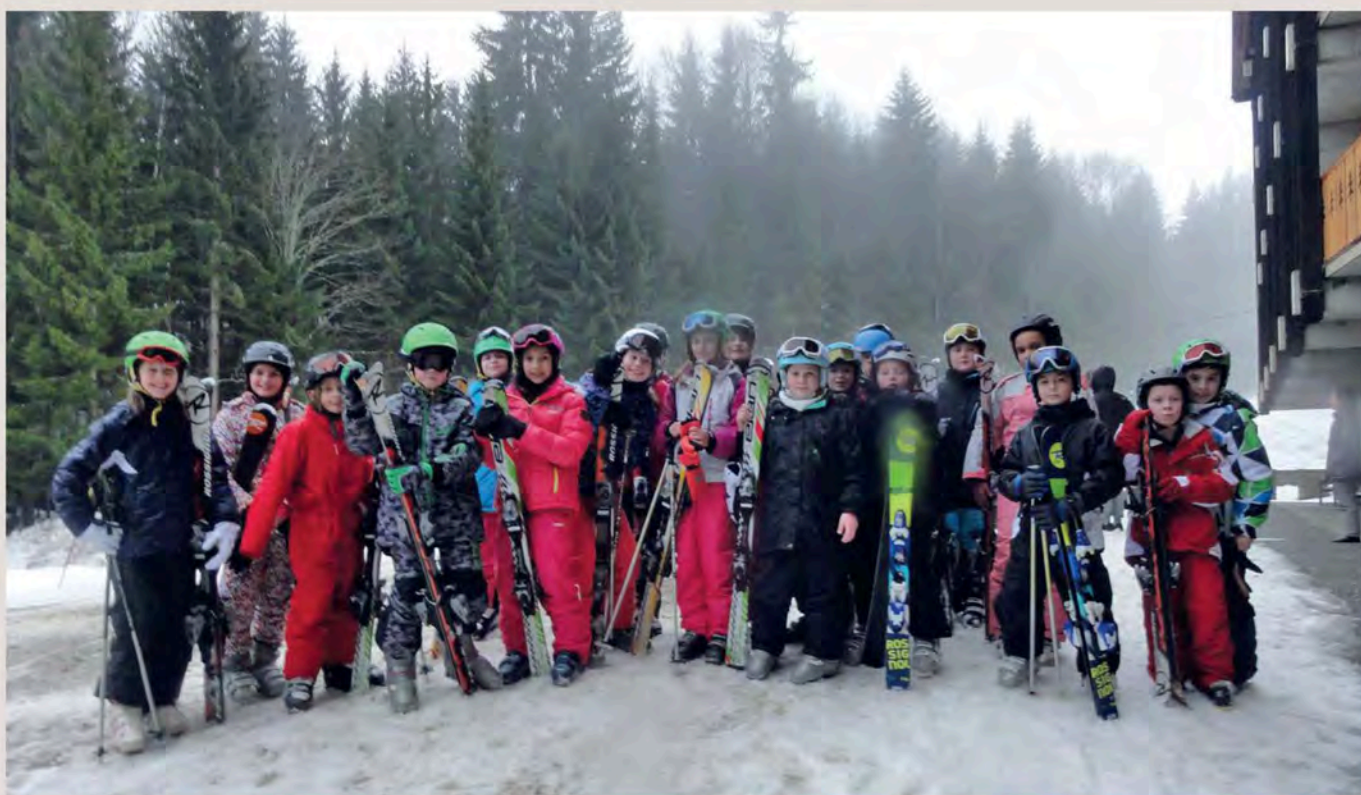
Les élèves de la classe de CM2 sont allés faire du ski au cours d'une classe de neige, qui s'est déroulée du 22 au 27 février à Saint-Nicolas-La-Chapelle, près de Megève.