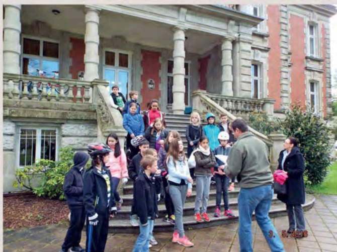
Les élèves des deux classes ont bénéficié d'une animation organisée par la Communauté d'Agglomération sur le thème de la sécurité routière : une partie théorique en classe, puis une partie pratique à l'Hôtel de la CASC.