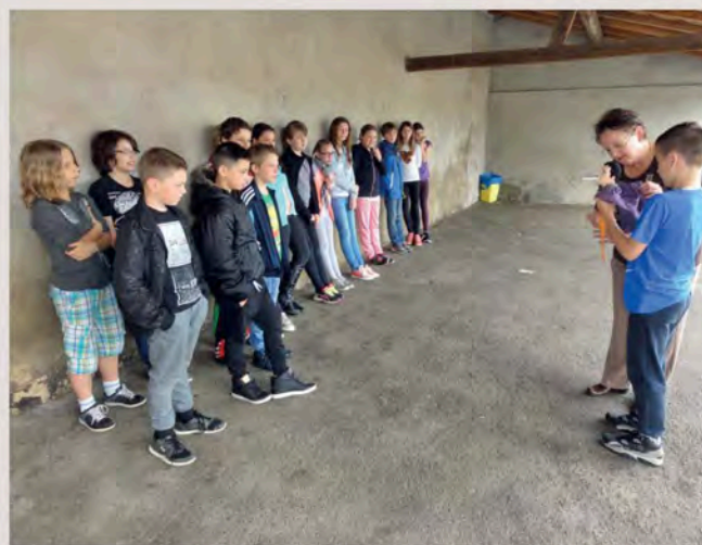
Un représentant de la Ligue contre le Cancer est venu parler des dangers de la cigarette aux élèves de CM2.